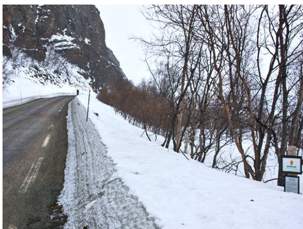
I Jagtfalkens rige

Da vi nu var kommet så langt, kunne vi lige så godt køre til Båtsfjord. Det blev en meget smuk køretur i et snehvidt landskab, hvorigennem den sorte landevej snoede sig i et grafisk, ofte storladent mønster.