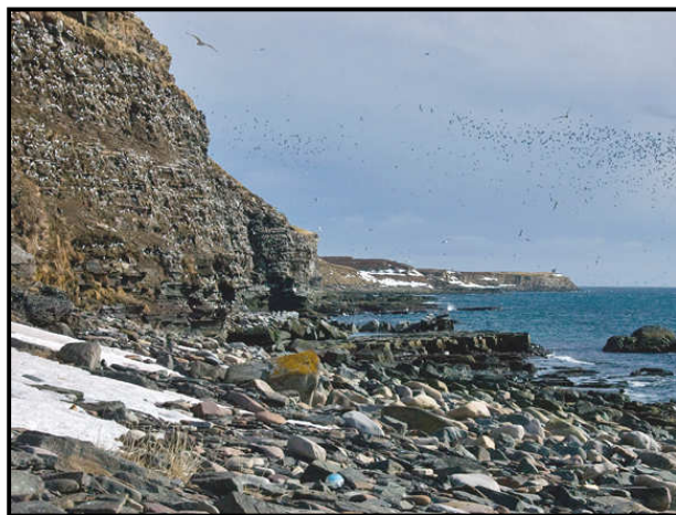
Ridekoloni på Ekkerøya