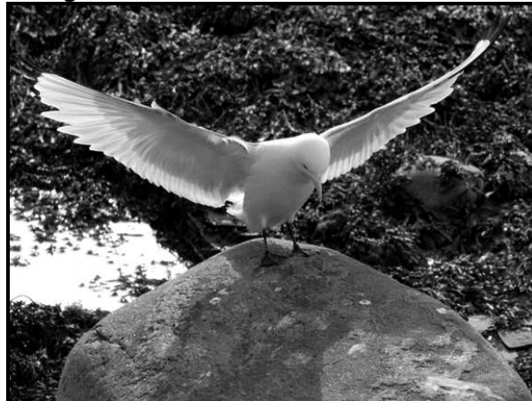
Et levende gravmonument

Kørte mod øst. Stoppede op ved Salttjern for at fotografere landskaber. Endte på Ekkerøya og fotografere Rider.