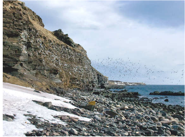
Rider skræmmes af Ravn. Ekkerøya