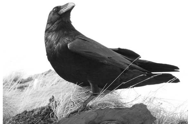
Ravn på fuglefjeld Ekkerøya

Turen gik derefter hjemad. En Fjeldvåge dukkede op over skråningerne på vores højre side, men for langt væk til fotografering. Besøgte igen Ekkerøya og gik denne gang ud til fuglefjeldet og fotograferede Ravn.