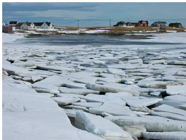
Skallelv, isen tøde bort i løbet af ugen.

Kørte til Skallelv, men her var ikke mange fugle, bortset fra Sortgrå Ryle, der på det tidspunkt måtte være den talrigeste vadefugl på Varangerhalvøen.