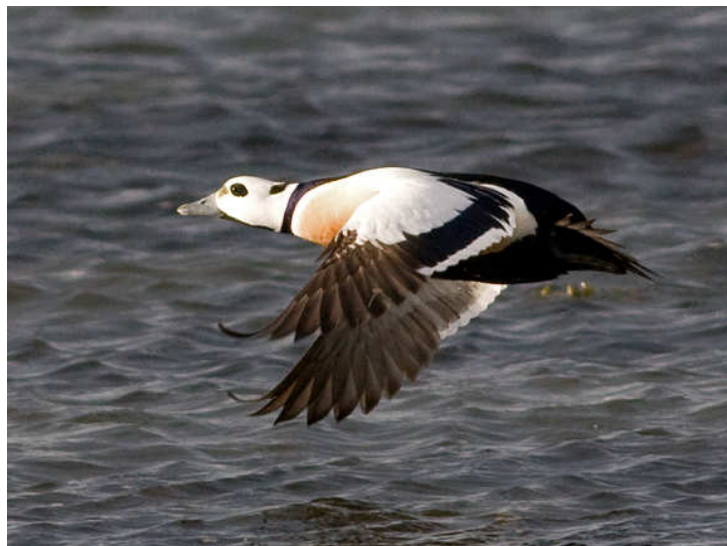
Stellersand - han Vadsø 30. april