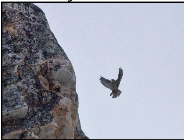
En ung Jagtfalk