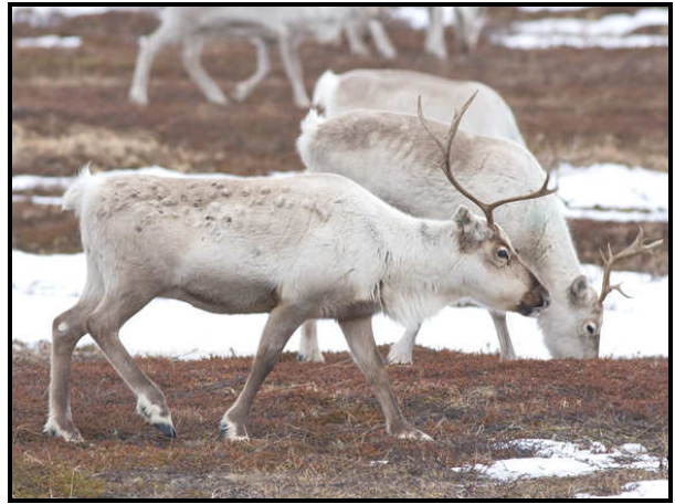
Tamrener er et udbredt husdyr på Varanger