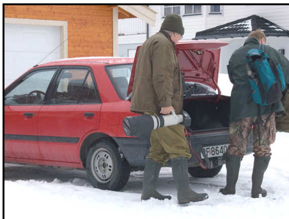
Vores 20 år gammel Mazda pakkes