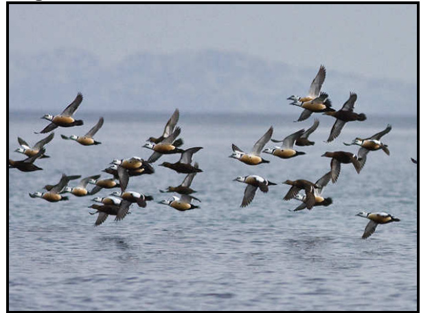
En Havørn skræmmer fuglene op

derved skabte mulighed for fine flugtbilleder.