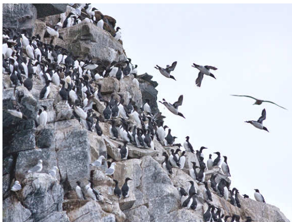
Lomvie og Polarlomvie Hornøya