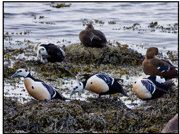
Stellersænder Kiberg Havn