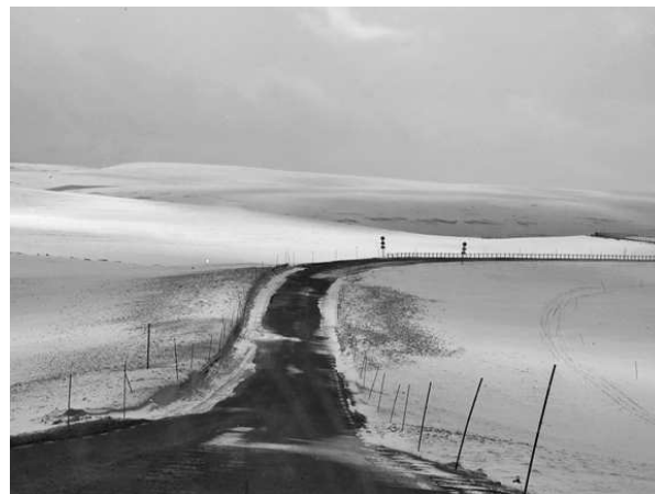
Vej til Båtsfjord

Da vi nu var kommet så langt, kunne vi lige så godt køre til Båtsfjord. Det blev en meget smuk køretur i et snehvidt landskab, hvorigennem den sorte landevej snoede sig i et grafisk, ofte storladent mønster.