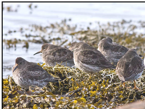
Sortgrå Ryle - en lille del af flok på ca. 150

Topskarv Gråand Stellersand Havlit Jagtfalk 2K Strandskade Sortgrå Ryle Hættemåge Svartbag Sølvmåge Ride Ravn Gråkrage Gråspurv