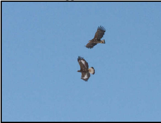
Havørn og Kongeørn

kredsende fugle med den nordiske blå himmel som baggrund.