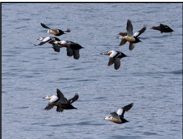
Stellersænder Kiberg Havn

Helt ude ved havneindløbet bag molen gemte der sig en stor flok Stellersænder, som vi akkurat nåede at få billeder af, inden de svømmede længere ud og vendte rumpen mod os.