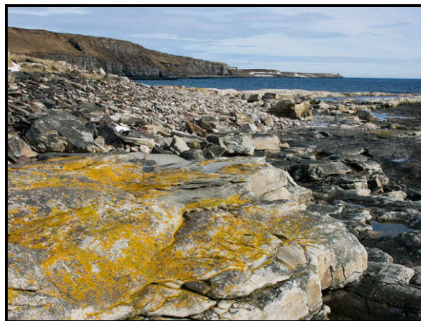
Fuglefjeld på Ekkerøya i ny vinkel

klippeflader tæt på brændingen stod Riderne i dag som de foregående dage som små hvide nipsenåle, der dog med et forvandlede til flyvende fugle, da en Svartbag fik dem på vingerne. Jeg kunne nu gå helt derud uden at forstyrre fuglene og derfra fotografere fuglefjeldet fra en ny vinkel.