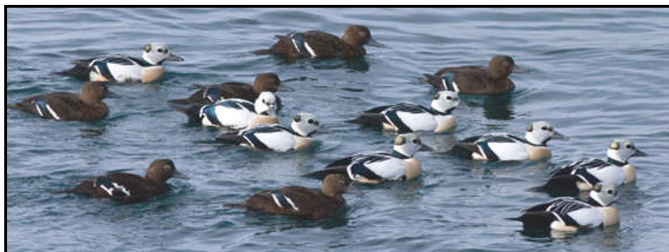
Stellersænder i Kiberg Havn

Siden jeg i juni 2004 besøgte Varangerhalvøen i det arktiske Nordnorge, har jeg haft et stort ønske om at vende tilbage, men på en anden årstid. Jeg gik med et forfængeligt håb om at komme på fotoafstand af Kongeederfugl og Stellersand. Ganske vist så jeg i 2004 Kongeederfugl hun og fik da også gode billeder af den, men den farvestrålende han så vi aldrig. Og Stellersænderne var så langt ude på vandet, at de rent fotografisk tog sig ringe ud.