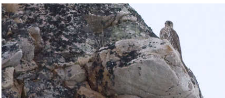
Her skimtes en ungfugl